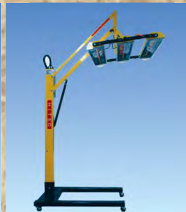
ルーフ、ボンネット乾燥